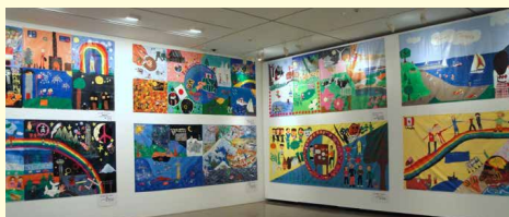
2011年12月 金沢21世紀美術館にて 「世界の子どもをつなぐアートマイル壁画展」 14カ国の子どもたちと共同制作した70点の作品を展示