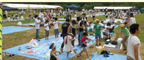
2007年度 兵庫県姫路城三の丸広場 「でっ描く!壁画プロジェクト in 姫路」 (子どもゆめ基金助成事業)