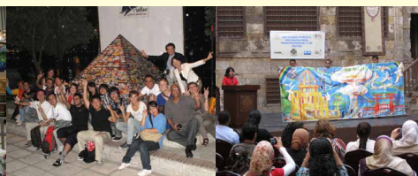
2010年9月エジプト・平和の祭典MURAMID展にて J A Mが日本のユースをエジプトに派遣して 世界に向けて非核平和のメッセージを発信 (国際交流基金助成事業、外務省・文部科学省他後援)