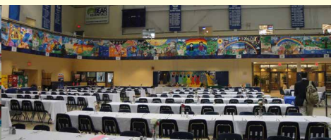
2010年7月カナダiEARN国際会議にて 「IIME アートマイル壁画展」 海外と共同制作した30点の壁画を展示すると共に 会議のハイライトとなるワークショップを開催