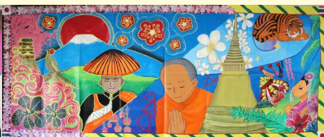
2012年度 [日本] 神奈川県星槎国際高等学校 [タイ] Plearnpasa Language School 「Hold each other in high regard」