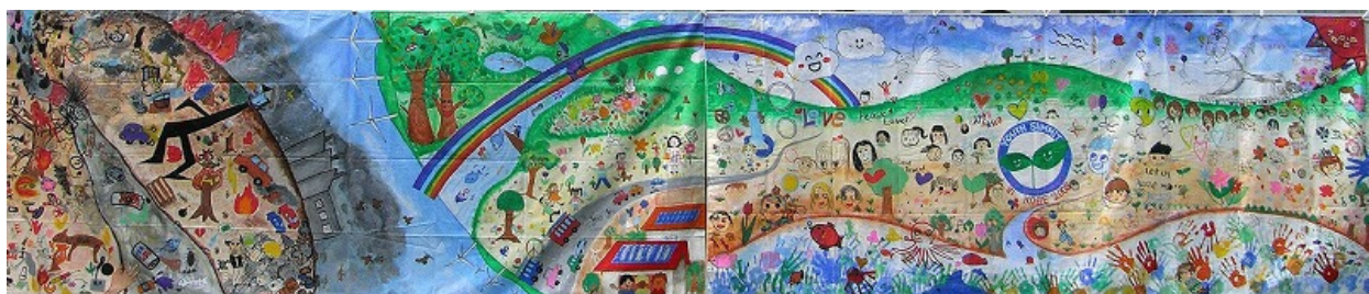
“Earth we do not want and Earth we want”

完成作品は2枚が繋がってひとつの絵になった。環境汚染が進んだ危機的な地球から緑の地球へ、そして全てのいのちが調和した未来の地球へと、子どもたちのメッセージが聞こえてくる壁画が完成した。